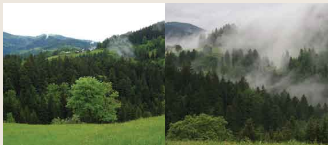
Kmetije in gozdovi severnega Pohorja

Sušek, M., 2010. Procesno dojemanje gozda na Gozdnem obratu v Radljah ob Dravi. Radlje, samozal., 110 s.